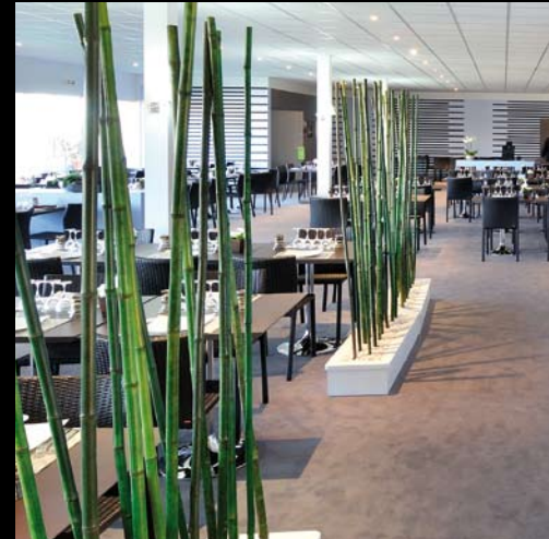
Chalet GEFAS - SIAE - Paris La Bourget