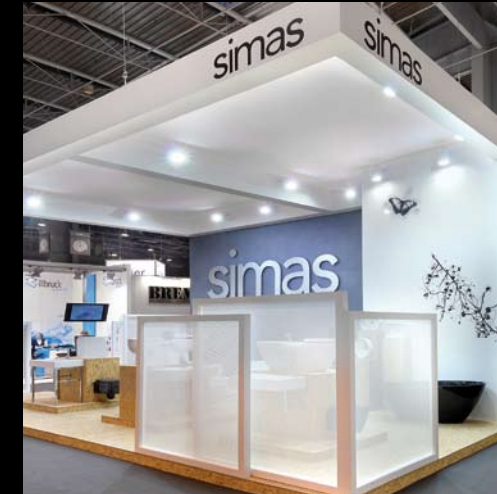
Simas - Idéo Bain