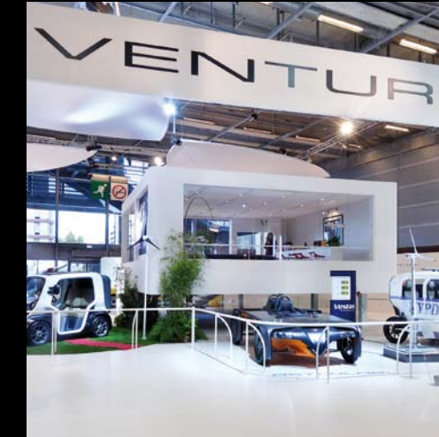
Venturi - Mondial de l'Automobile

Former une équipe qui prolonge le projet de votre entreprise.