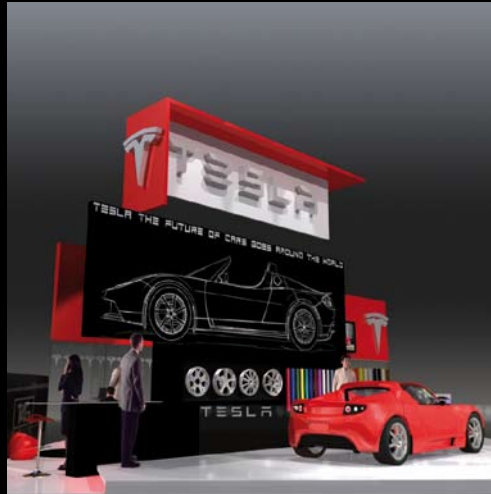
Projet TESLA - Paris