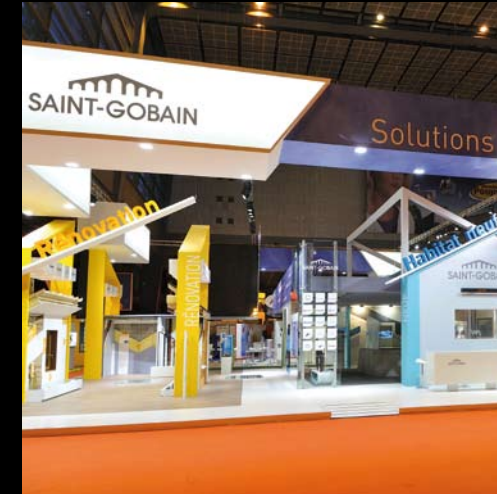
Saint-Gobain - Batimat