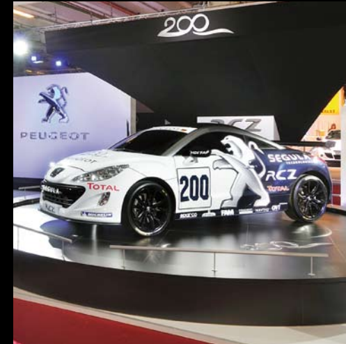
Peugeot - Salon du Cabriolet