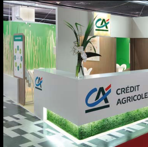
Crédit Agricole - Actonaria