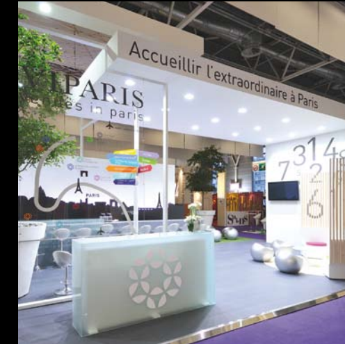
Viparis - Heavent