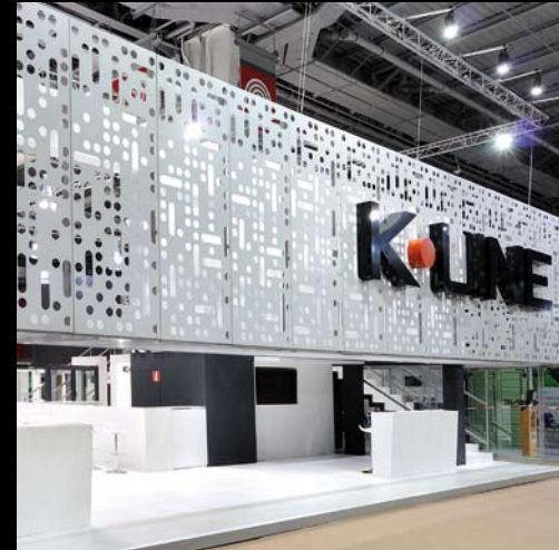
K-Line - Batimat